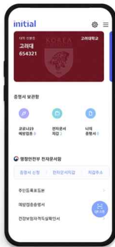
▲ 모바일 학생증 [기본발급]

※ 외국인 학생은 5페이지의 Ⅲ. Non-Financial Student ID (Foreign Students Only) 내용을 참고하시기 바랍니다.